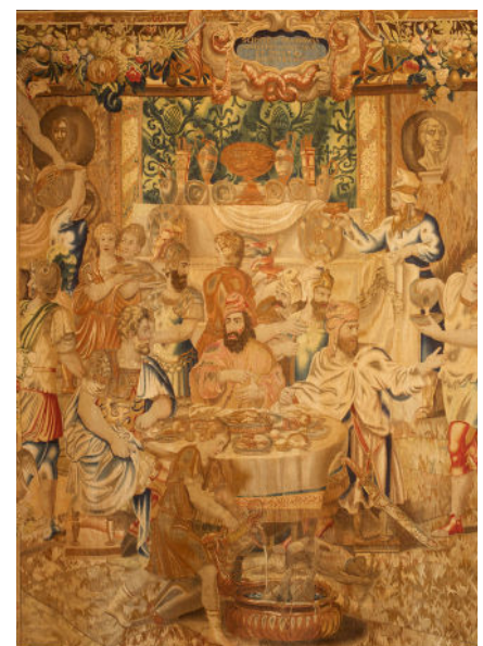
Tenture de l'Histoire de Scipion : Le repas de Syphax (détail), vers 1660 Manufacture de Bruxelles