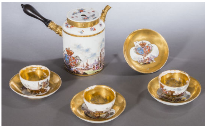
Nécessaire à thé et à chocolat de Marie Leszczyńska : chocolatière, trois bols à thé et quatre sous-tasses Musée national des châteaux de Versailles et de Trianon

Ce nécessaire en porcelaine peinte et dorée, conservé au Musée national des châteaux de Versailles et de Trianon, est présenté dans le cadre de la reconstitution de la « salle de café » du maréchal Maurice de Saxe et illustre l'introduction et la diffusion des boissons dites « nouvelles » (café, thé, chocolat) au XVIII e siècle. En décembre 1737, Maurice de Saxe offrit à la reine Marie Leszczyńska ce somptueux nécessaire à thé et à chocolat en porcelaine de Meissen, de la part de Frédéric-Auguste II, électeur de Saxe et roi de Pologne sous le nom d'Auguste III, faisant de ce service l'un des plus célèbres cadeaux diplomatiques du XVIII e siècle européen.