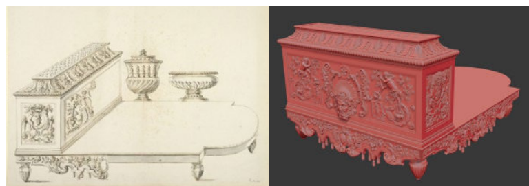
Modélisation du cadenas du roi (Aristeas) à partir du dessin sur papier du cadenas d'or de Louis XIV attribué à Jean Bérain I (1640-1711), 1703, Stockholm, Nationalmuseum.

Modélisé en 3D à partir de dessins conservés au Musée national de Stockholm, le cadenas emblématique de la table royale de Louis XIV, est présenté dans la reconstitution du dîner de 1685. Le cadenas est un coffret en métal précieux et verrouillé, pouvant contenir divers contrepoids, le couvert et la serviette du roi ainsi que des épices, du sel et du sucre. Il témoigne du faste de la table du Roi-Soleil et du raffinement des objets liés au cérémonial du repas.